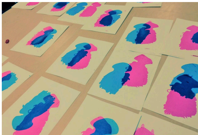
Impresiones de demostración de alumnos del instituto Travis, 2014

Debate en grupo: ¿Qué es lo que más te ha gustado de la serigrafía? ¿Qué es lo que menos te ha gustado? Repasa el proceso de aprendizaje. ¿Qué has aprendido hoy que te ayudará en tu próxima impresión?