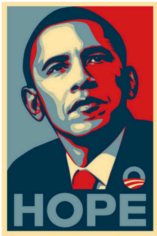
Shepard Fairey Barack Obama "Hope" Poster, 2008 Serigraph, 86 × 61 cm, 36 × 24 in.