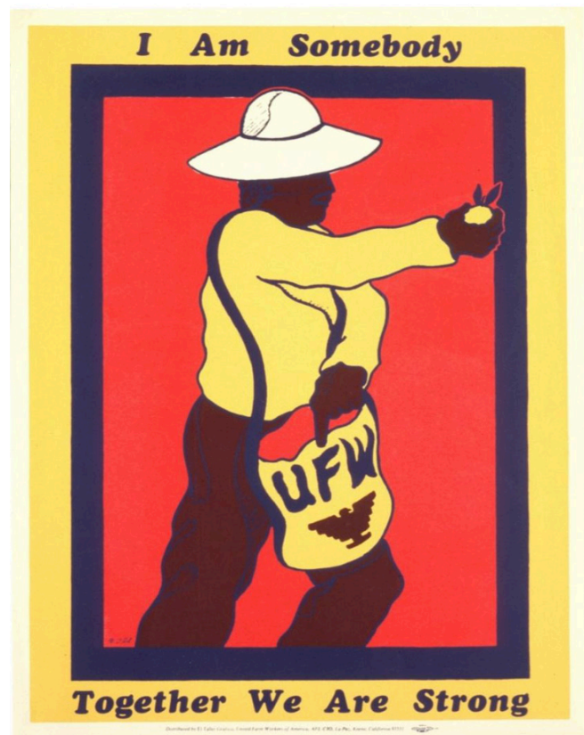
El Taller Gráfico I Am Somebody: Together We Are Strong. Ca. 1975 Screenprint on paper, 22 5/8 × 17 1/2 in.