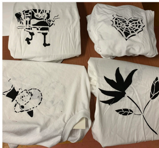
Diseños de plantillas realizados por alumnos de Screen-It! Fotos de Jasmine Chock, 2023