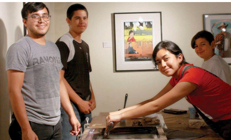
Instructores y estuديات de Screen It! en el Museo Mexic-Arte en Austin, TX.