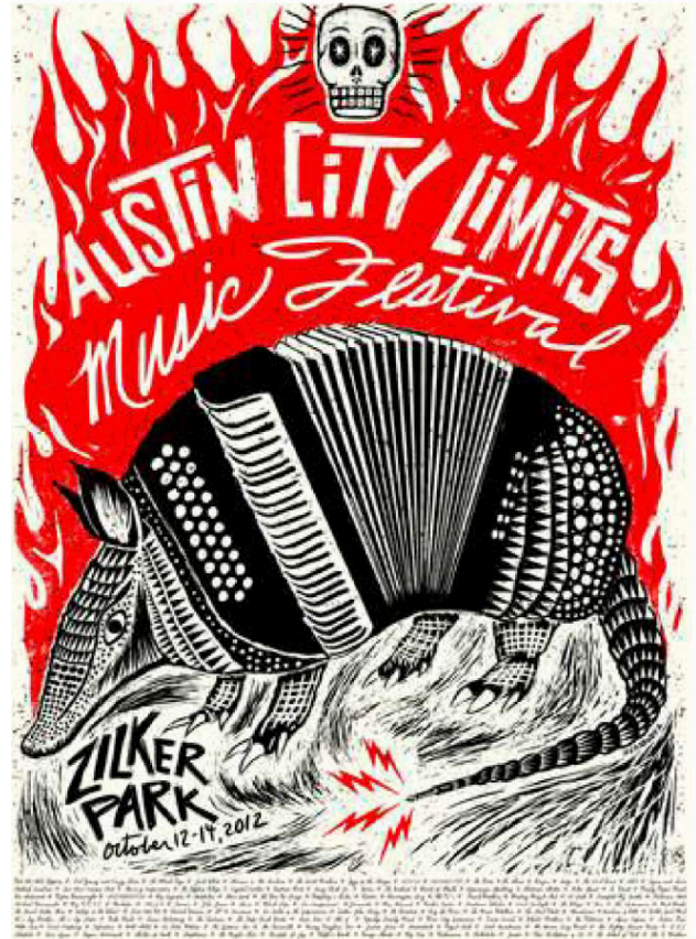
Carlos Hernandez Austin City Limits Music Festival, 2012 Serigraph, 18" x 24" Image retrieved online